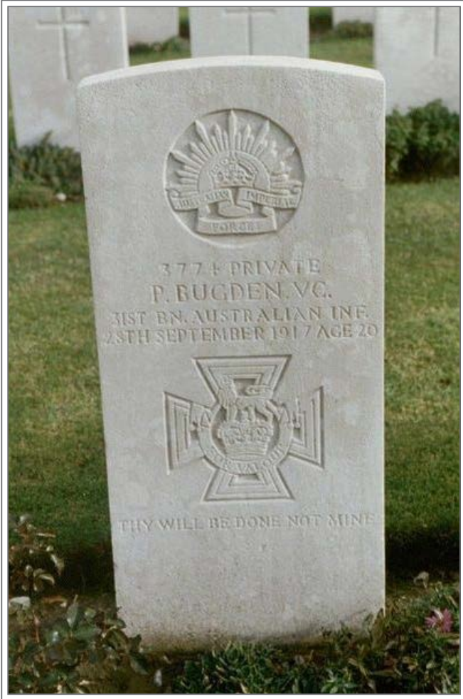
Un Australien ayant reçu la croix de Victoria