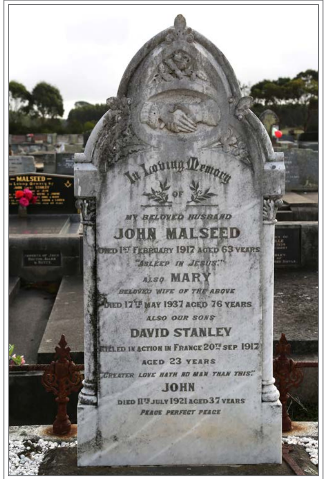
Caveau de la famille Malseed, Condah, état de Victoria